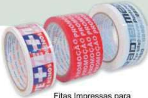
Fitas Impressas para fechamento de caixas