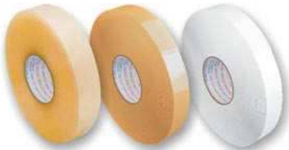
Fitas Transparentes, marrom, brancas e impressas em Rolos Longos e curtos