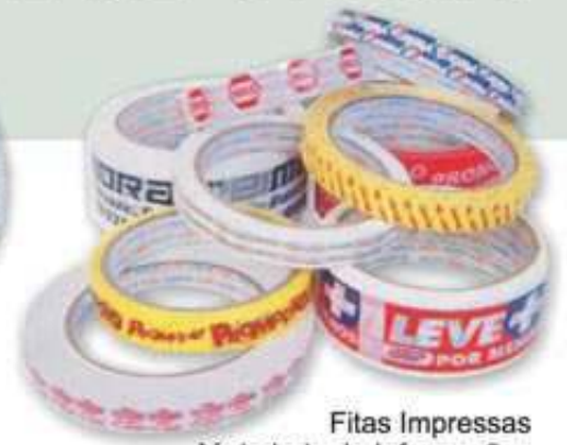
Fitas Impressas Variedade de Informações ou sua logomarca