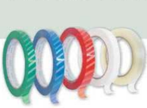
Fitas Tarjadas Coloridas